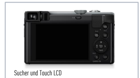
Sucher und Touch LCD